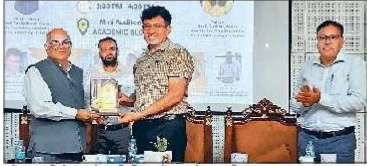
महेंद्रगढ़। विशेषज्ञ को स्मृति चिह्न भेंट करते कुलपति।

उन्होंने महिलाओं की सुरक्षा, अपराध और अधिकारियों की जवाबदेही जैसे मुद्दों पर भारतीय